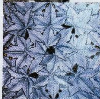
RHAPSODY : Ardoise verte 60 x 60 x 2 cm recto verso.