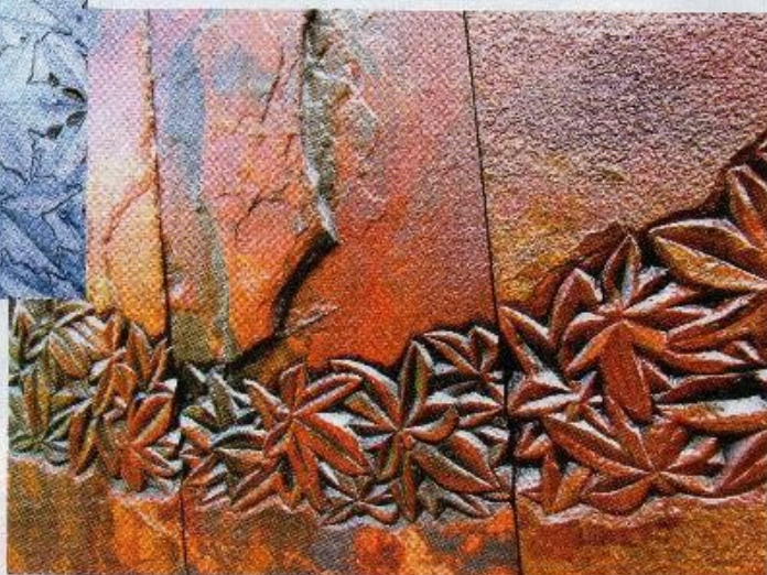
OCTOBRE : Tryptique ardoises oxydées 47 x 32 x 1 cm recto verso.