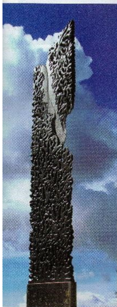
ABYSS : Ardoise 113 x 23 x 2 cm recto verso.